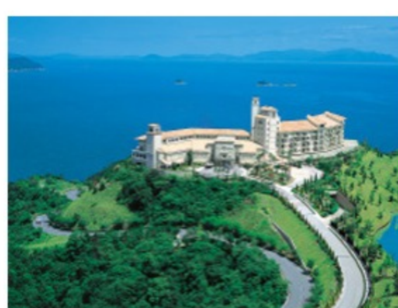
グランドエクシブ鳴門