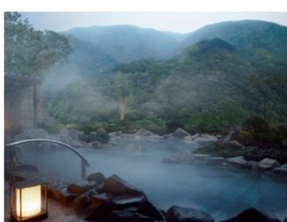
エクシブ箱根離宮

リゾートトラストの会員なので全国の会員制高級リゾートホテルに格安で宿泊できます。